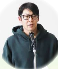
挨拶をする関口部長