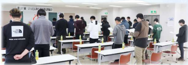
青年部組織綱領朗唱