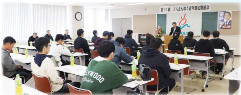
第27回 J A えんゆう 青年部定期総会