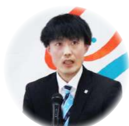
挨拶をする城岡部長