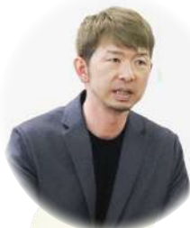
議長を務める岩城組合長