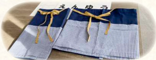
優秀賞に選ばれました！