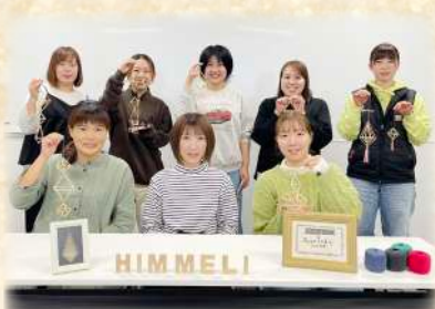
素敵な作品を作ることが出来ました！