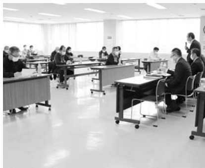
秋季農事部懇談会の様子

秋季農事部懇談会を、令和2年11月25日～12月1日にかけて、22地区8会場で行われ、多くの組合員に出席していただきました。懇談会では、今年度の作況、JA事業の進捗状況や今後の取組などを説明し、組合員からはJAに対する貴重な意見要望が寄せられました。 主な事項については、皆様にお知らせするとともに、理事会において十分検討し、今後の事業推進に反映させてまいります。なお、記載漏れや内容の不備があったときはご容赦願います。