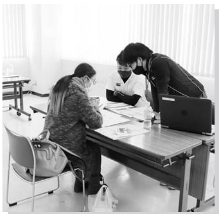
JAコネクト説明の様子