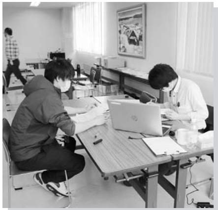
計画書作成支援の様子

会場では、組合員が作成した営農計画書をもとに、各担当職員が経営状況を分析、今年の生産出荷計画等を作成しました。また、今年から試験的に形式データでの作成・提出を開始し、今後計画書の作成作業が円