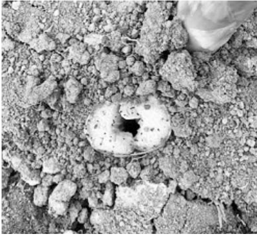
写真 春芽の空洞症

今年度は、春芽において茎の空洞症が発生しました(写真)。原因として、冬期間の少雪によって土壌凍結が深く入り、根が水分や養分を吸収できなかったためだと考えられます。空洞症が多発すると、製品率の低下を招きます。対策として、春先の気象を考慮し、ハウスを被覆するタイミングを見極めることが重要です。