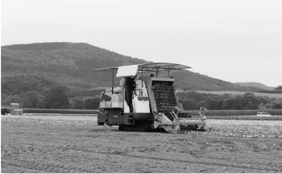
玉ねぎ収穫作業の様子

Aの玉ねぎ選果施設で選果・出荷作業が始まりました。玉ねぎ生産農家から集荷された玉