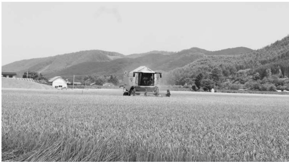
収穫作業の様子。コンバインで一気に収穫します。

黄金色に染まった小麦畑が見られるようになった7月27日の白滝地区を皮切りに、当JA管内各地区で秋まき小麦の収穫作業が始まりました。