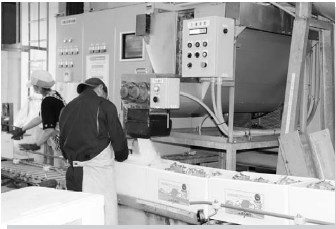
選果場では大きく育ったブロッコリーを手際良く整えて出荷します