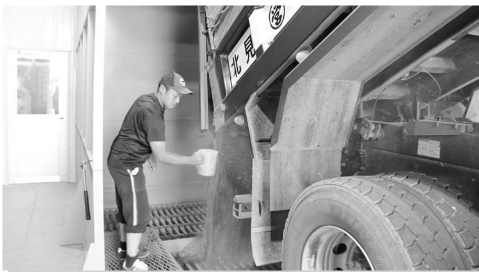
麦乾施設での受入作業の様子

収穫作業は大型のコンバインを使って小麦を刈り取り、ダンプロックに積み替えたあと、遠軽町清川の穀類乾燥調製貯蔵施設に次々と運び