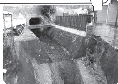
写真(3) 高知県四万十町