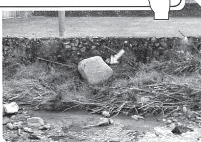
写真(1) 福岡県朝倉市