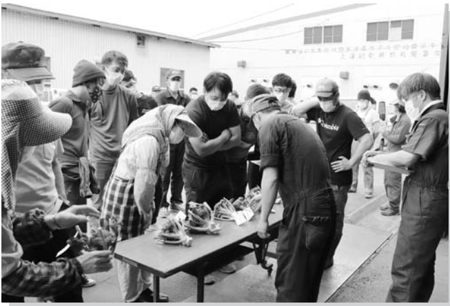
目合わせ会の様子