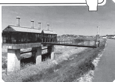
写真(2) 三重県伊勢市