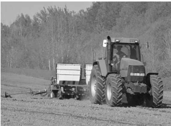
急ピッチで播種が進められていきます