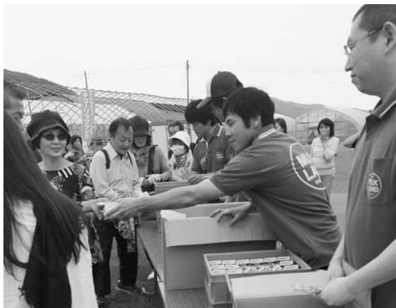
多くの消費者の方々に来てもらえました

乳500個、アイスクリーム200個、PR用特製ポケットティッシュ1000個を「ぜひ美味しい乳製品を味わって下さい」と配布を始めると、開始から30分ほどでなくなるにぎわいで有意義なうちに終わることが出来ました。