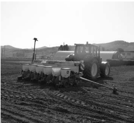
播種機を使って作業が進められています