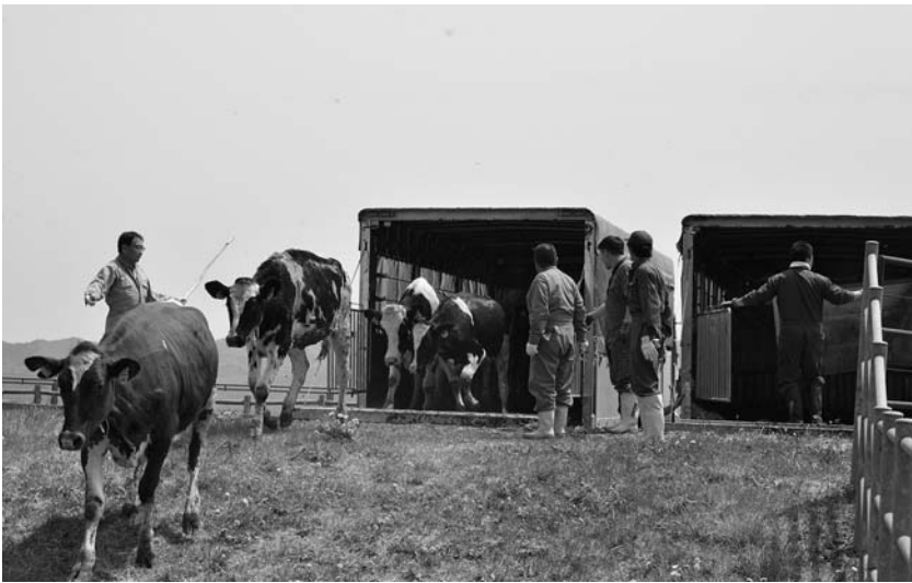
家畜運搬車から牧場に放たれる牛たち

牛たちがすくすくと育って、組合員の皆さんの牛舎に戻って活躍することを祈念申し上げます。