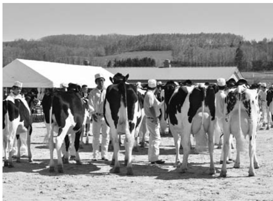
第15部同志会別牛群の部では惜しくも1位は逃すが見事2位入賞

全13部で乳房の形状や肢の長さ、骨格の正確性、発育具合など、酪農家が求める資質をもった優れた乳牛を選びました。