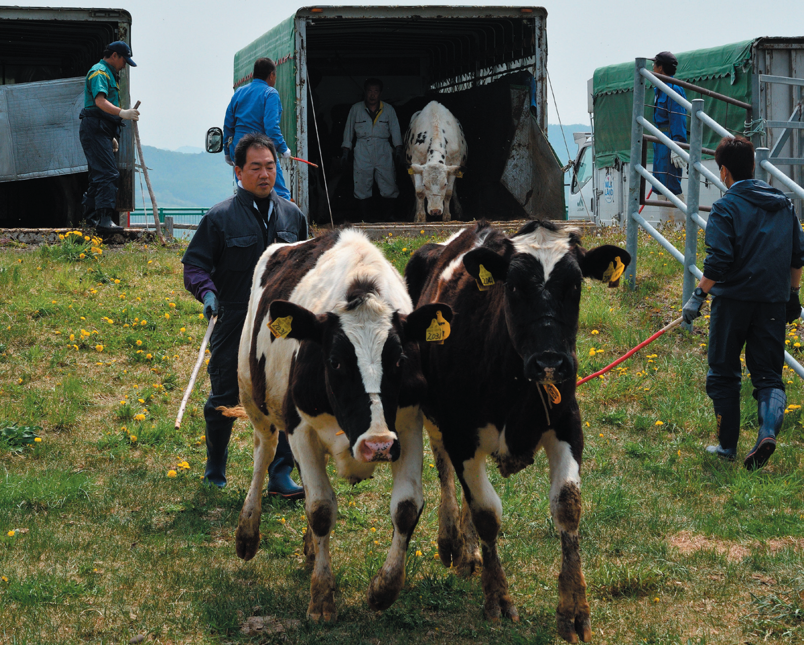
公共牧場の牛受入作業の様子 (遠軽町見晴牧場)