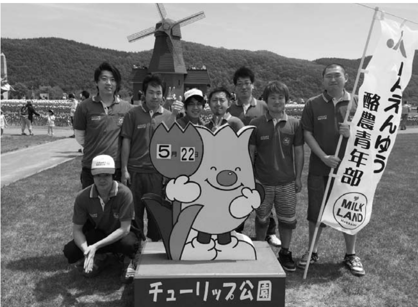
多くの消費者にPRすることが出来ました

今回用意した牛乳500個、アイスクリーム200個、PR用特製ポケットティッシュ1000個を「ぜひ美味しい乳製品を味わって下さい」と配布を始める、開始から30分ほどでなくなるにぎわいで有意義なうちに終わることが出来ました。