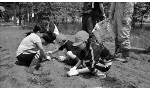
子供農業体験学習の様子 青空の下で楽しい体験学習ができました

収穫作業をして、最後に子供たちが自身が育てた野菜をつかって、カレーライスをつくる調理実習をする予定です。