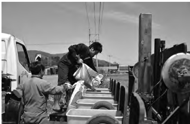
J Aコントラクターによる播種作業の様子

J Aコントラクターによる播種作業は、六月上旬までおこなわれる予定となっております。