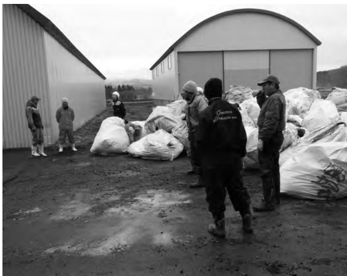
廃棄物回収した部員各位お疲れ様でした

部員たちが各農家から回収した廃プラスチックなどの廃棄物を集荷場所に持ち寄り、回収業者に引き渡しました。