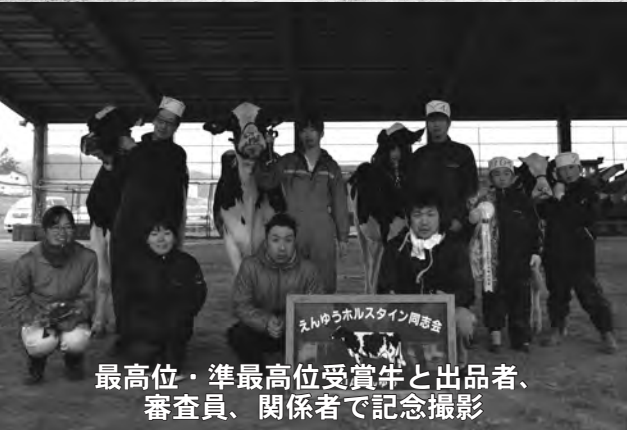
最高位・準最高位受賞牛と出品者、審査員、関係者で記念撮影