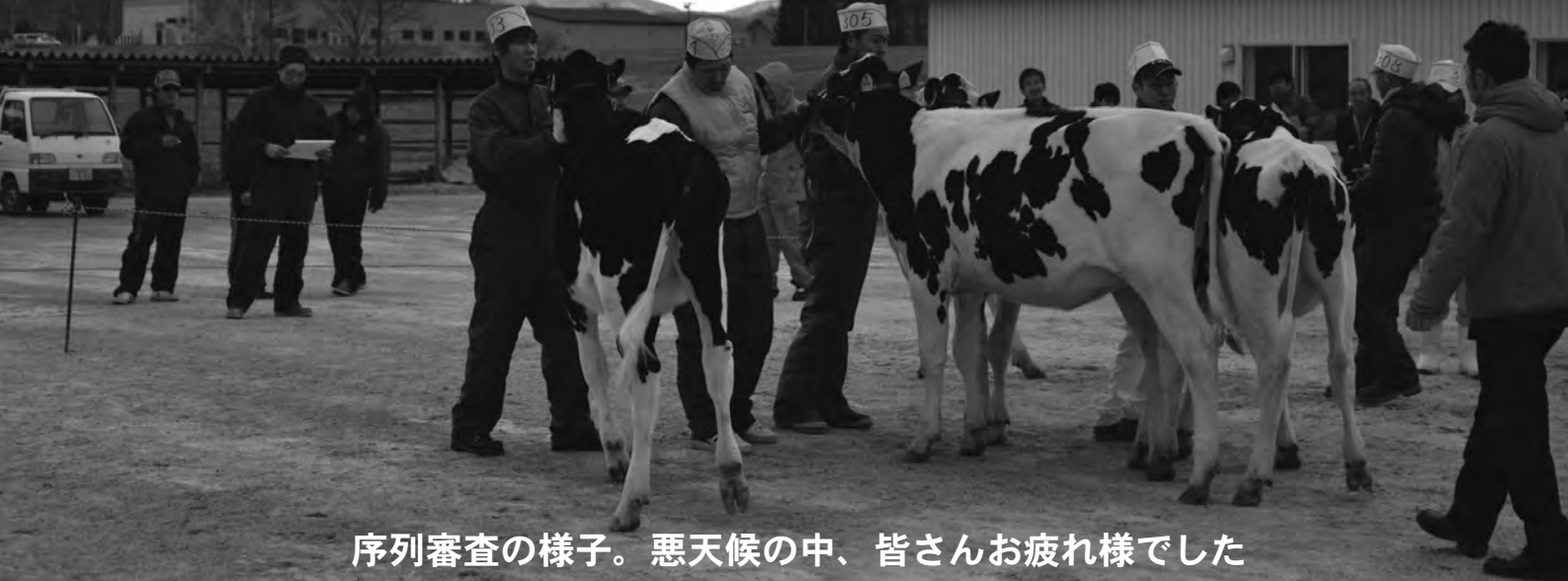
序列審査の様子。悪天候の中、皆さんお疲れ様でした