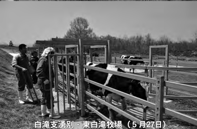
白滝支湧別・東白滝牧場(5月27日)