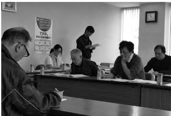
えんゆう農協和牛振興会定期総会の様子

また、総会終了後に、研修会とビーブランドで会員が肥育した牛肉で懇親会をおこない、盛会のうちに散会となりました。