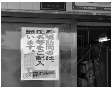
入口に設置した家畜防疫カレンダー(上)と出入口に掲げた記入のお願い文章(下) (写真：社名淵みどり牧場さんの設置例)

この度、遠軽町、J A、普及センター、N O E S A I オホーツクで構成される遠軽町家畜自衛防疫組合では、農場に訪問した方々を記録するために、農場訪問者記録用の「家畜防疫カレンダー」を作成しました。 このカレンダーは、国の飼養衛生管理基準で、牧場内に畜産関係者等の入出場を記録し、一年間保管することが定められたことから、記帳の簡単さと保管のしやすさを考慮して作成され、遠軽町内九三戸の家畜飼養者に配布されております。