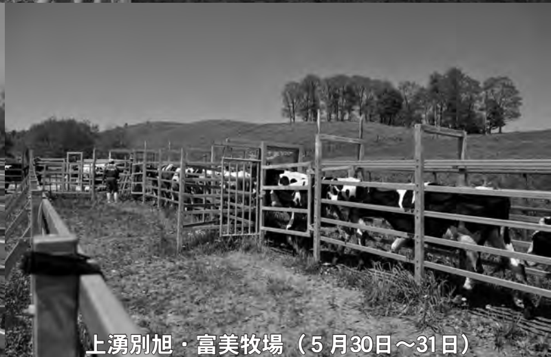
上湧別旭・富美牧場(5月30日～31日)