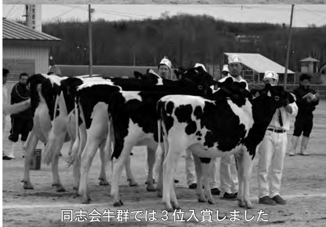
同志会牛群では3位入賞しました