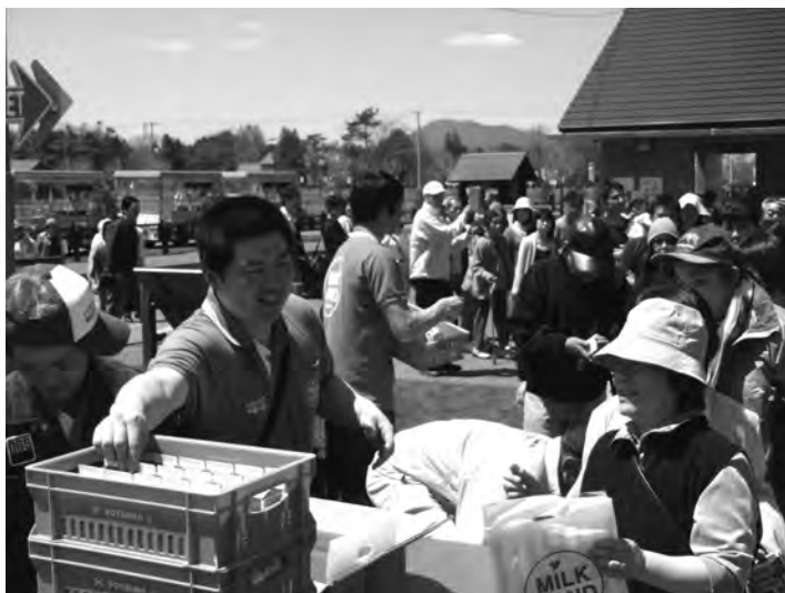
多くの方々にご来場していただきました

当日は、天候に恵まれたこともあり、多くの観光客が来場しており、開始前から配布場所の前には長蛇の列が出来、今回用意した牛乳五〇〇個も配布開始から三〇分ほどで無くなる賑わいで、盛会のうちに終わることが出来ました。