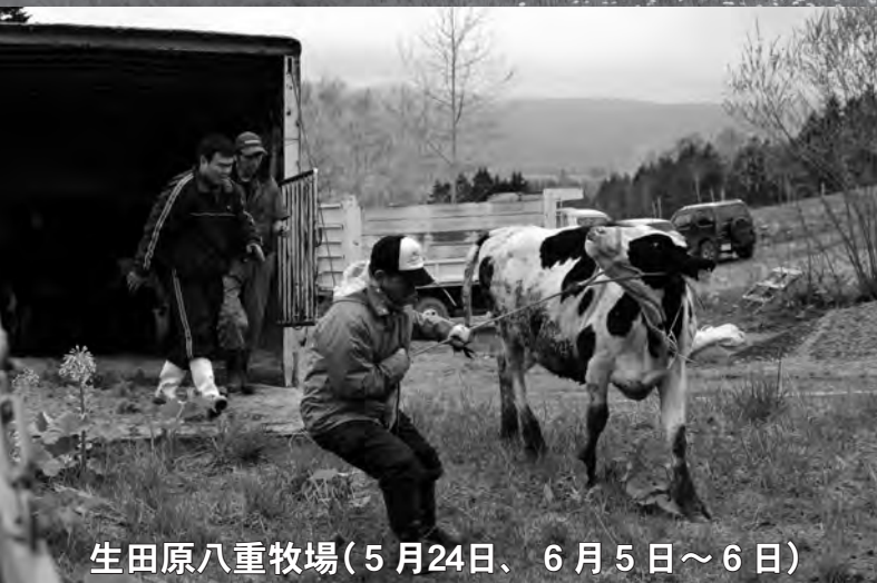
生田原八重牧場(5月24日、6月5日～6日)