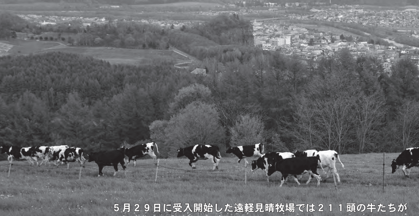
5月29日に受入開始した遠軽見晴牧場では211頭の牛たちが