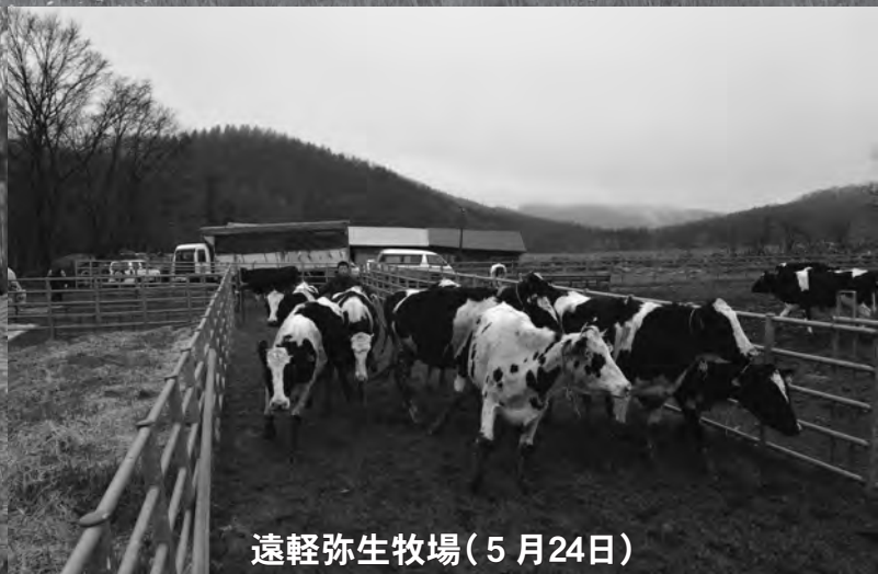
遠軽弥生牧場(5月24日)